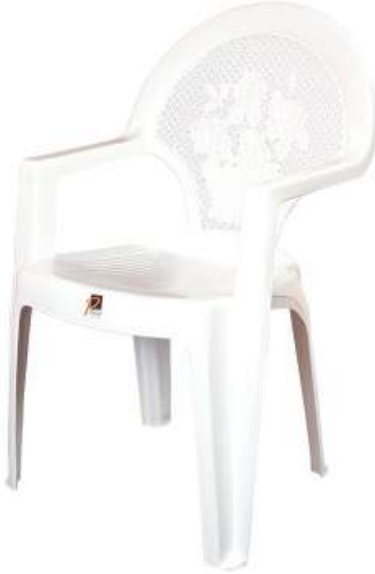
كرسي ملكي Royal Chair

Length : 510 mm : الطول Width : 500 mm : العرض Height : 875 mm : الارتفاع