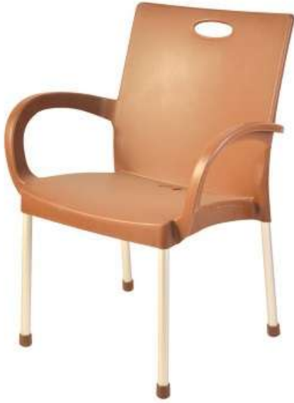
كرسي بدون بيد / أرجل المنيوم Modern Chair / Aluminium Leg