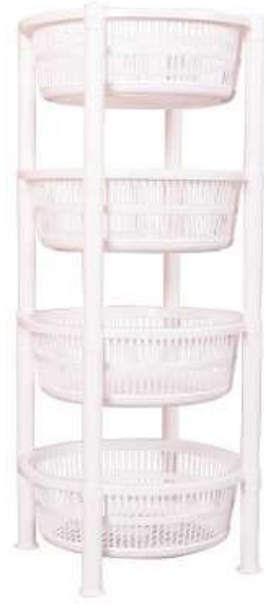
أرفف تخزين (خضار) دائري ٤ دور Vegetable Shelves (Round 4 Rack)

Diameter : 390 mm : قطر الدائرة Height : 595 mm : الارتفاع