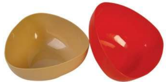
زبدية بيضاوي (٤ لتر) Oval Bowl (4 Ltr)

Diameter : 312 mm : قطر الدائرة Height : 87 mm : الارتفاع