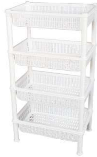
أرفف تخزين (خضار) مستطيل ٤ دور Vegetable Shelves (Rectangle 4 Rack)

Length : 450 mm : الطول Width : 304 mm : العرض Height : 600 mm : الارتفاع