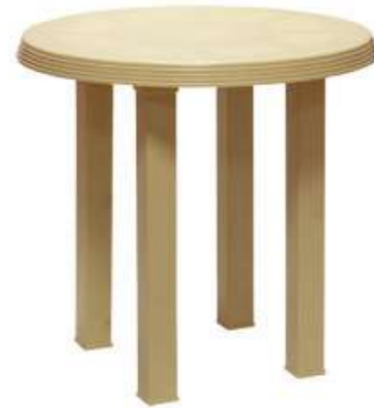
طاولة دائرية صغيرة (أرجل قابلة للإزالة) Round Table (Removable Legs)

Length : 900 mm : الطول Width : 900 mm : العرض Height : 750 mm : الارتفاع