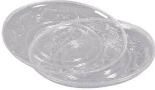
صحن حلويات دائري Sweet Crystal Tray