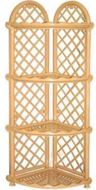
أرفف حمام ركن ٤ دور Corner Shelves (4 Rack)

Length : 295 mm : الطول Width : 295 mm : العرض Height : 628 mm : الارتفاع