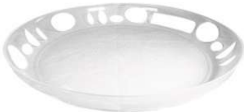
صحن مدينة كريستال Crystal City Tray (Round)

Diameter : 475 mm : قطر الدائرة Height : 55 mm : الارتفاع