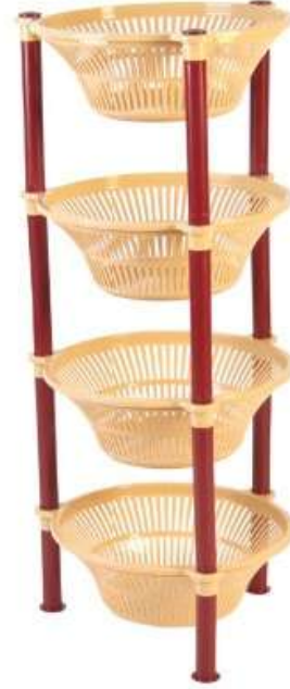
أرفف تخزين (خضار) ٤ دور Vegetable Shelves (4 Rack)

Diameter : 375 mm : قطر الدائرة Height : 590 mm : الارتفاع