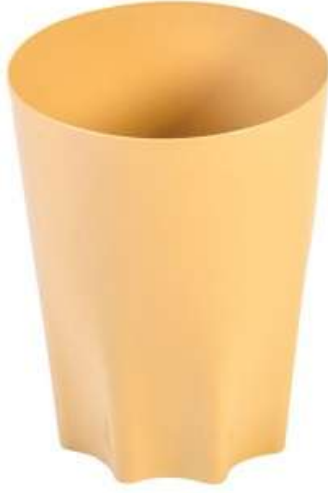
سلة مهملات عصرية (١٠ لتر) Modern Trash Bin (10 Ltr)