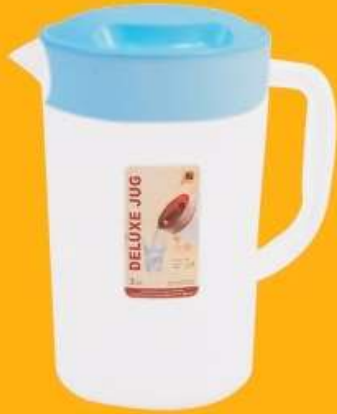
جك ديلوكس (٣,٥ لتر) Deluxe Jug (3.5 Ltr)