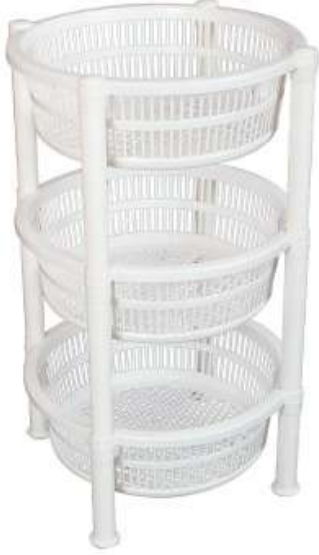
أرفف تخزين (خضار) دائري ٣ دور Vegetable Shelves (Round 3 Rack)