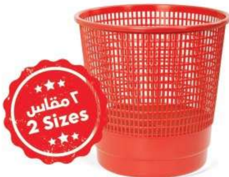
سلة مهملات صغير (٨ لتر) Trash Bin (Small) (8 Ltr)

قطر الدائرة : 285 mm : الارتفاع : 290 mm :