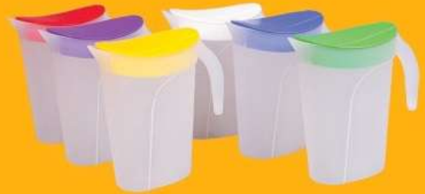
جك ماء كبير (٣,٥ لتر) Water Jug (3.5Ltr)