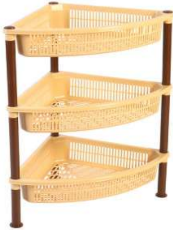
أرفف تخزين زاوية (خضار) ٣ دور Vegetable Shelves (Corner 3 Rack)

Diameter : 390 mm : قطر الدائرة Height : 815 mm : الارتفاع