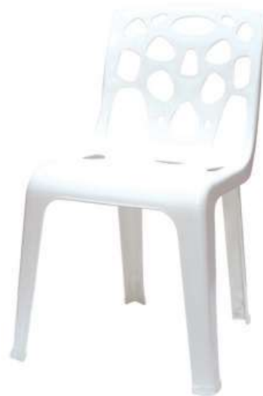
كرسي أوربت بدون يد Orbit Armless Chair

Length : 585 mm : الطول Width : 605 mm : العرض Height : 760 mm : الارتفاع