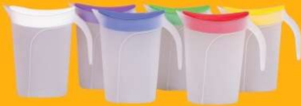
جك ماء صغير (٢ لتر) Water Jug (2 Ltr)