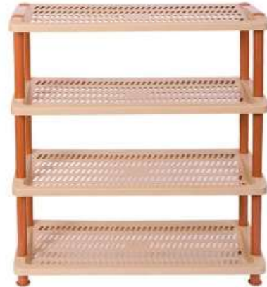
أرفف جزم ٤ دور Shoe Rack (4 Rack)

Length : 665 mm : الطول Width : 273 mm : العرض Height : 525 mm : الارتفاع