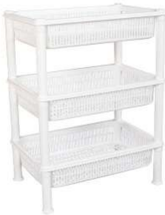
أرفف تخزين (خضار) مستطيل ٣ دور Vegetable Shelves (Rectangle 3 Rack)

Diameter : 375 mm : قطر الدائرة Height : 805 mm : الارتفاع