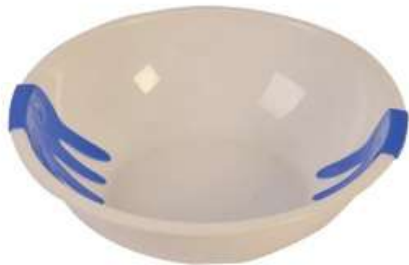
صحن سلطة مع شوكة (٤ لتر) Salad Bowl with Forks (4 Ltr)

Diameter : 360 mm : قطر الدائرة Height : 103 mm : الارتفاع