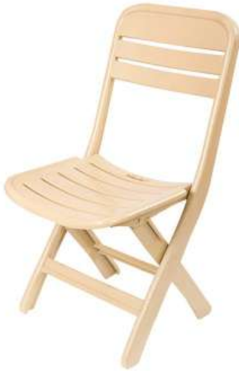
كرسي تطبيق Folding Chair

Length : 635 mm : الطول Width : 575 mm : العرض Height : 890 mm : الارتفاع