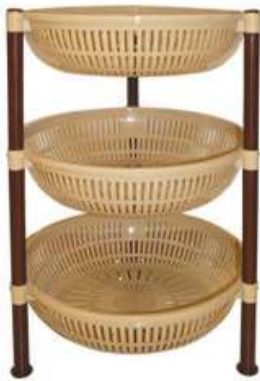
أرفف تخزين دائرية (٣ دور) Round Shelves (3 Rack)