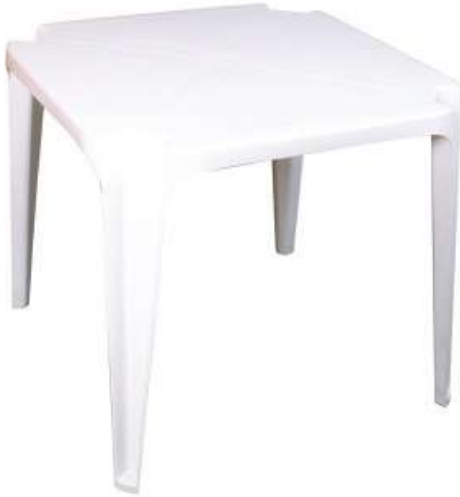
طاولة مربعة كبيرة (أرجل ثابتة) Square Table

Length : 900 mm : الطول Width : 630 mm : العرض Height : 460 mm : الارتفاع