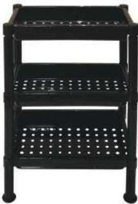
أرفف تخزين مستطيل (٣ دور) Rectangle Shelves (3 Rack)

Length : 470 mm : الطول Width : 370 mm : العرض Height : 820 mm : الارتفاع