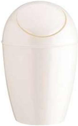
سلة مهملات أوربت (١٠ لتر) Orbit Trash Bin \ Fan Cover (10 Ltr)

Length : 245 mm : الطول Width : 195 mm : العرض Height : 365 mm : الارتفاع