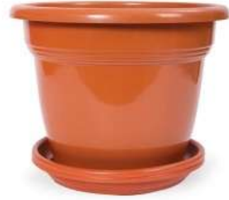
مركز زرع برواز مع صحن مقاس ٢٠ Planter w/Tray Size 20 w/Frame (2Ltr)

Diameter : 295 mm : قطر الدائرة Height : 240 mm : الارتفاع