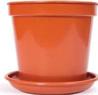
مركز زرع مع صحن مقاس 25 Planter with Tray Size 25 (8Ltr)

Diameter : 310 mm : قطر الدائرة Height : 295 mm : الارتفاع