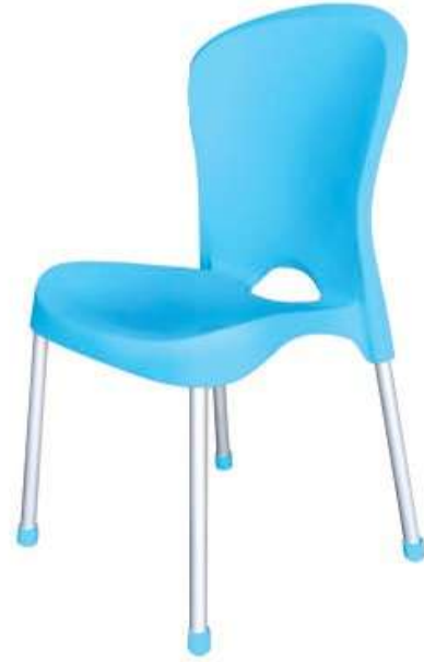
كرسي بدون يد عصري / أرجل المنيوم Modern Armless-Chair / Aluminium Leg

Length : 615 mm : الطول Width : 550 mm : العرض Height : 855 mm : الارتفاع