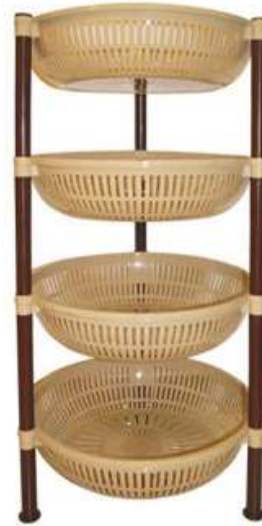
أرفف تخزين دائرية (٤ دور) Round Shelves (4 Rack)

Diameter : 480 mm : قطر الدائرة Height : 590 mm : الارتفاع