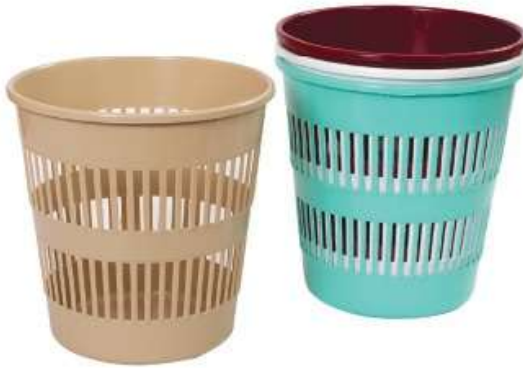
سلة مهملات وسط (١٢ لتر) Trash Bin (Medium) (12 Ltr)

قطر الدائرة : 335 mm : الارتفاع : 350 mm :