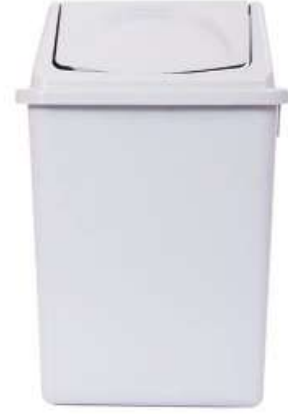
سلة مهملات مع غطاء مروحة (٨ لتر) Trash Bin \ Fan Cover (8 Ltr)

Diameter : 245 mm : قطر الدائرة Height : 315 mm : الارتفاع