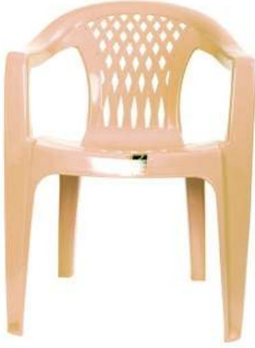
كرسي ماسي Diamond Chair