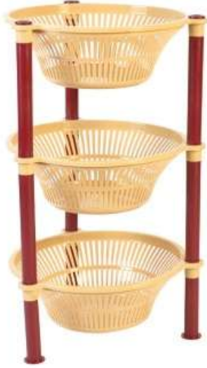
أرفف تخزين (خضار) ٣ دور Vegetable Shelves (3 Rack)