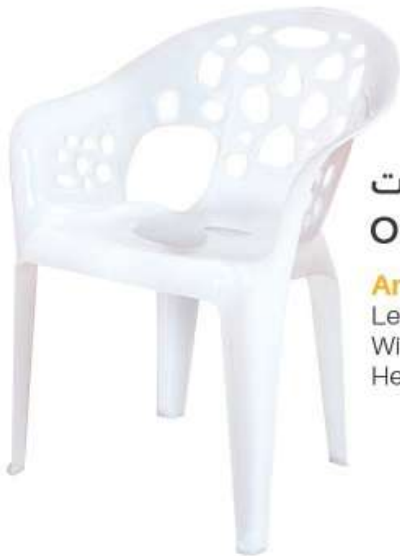
كرسي أوربت Orbit Chair

Length : 492 mm : الطول Width : 530 mm : العرض Height : 860 mm : الارتفاع