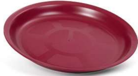
تبيسي دائري Food Tray (Round)

Diameter : 255 mm : قطر الدائرة Height : 25 mm : الارتفاع