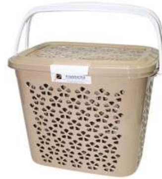
سلة رحلات صغيرة Picnic Basket (Small)

Length : 385 mm : الطول Width : 285 mm : العرض Height : 375 mm : الارتفاع