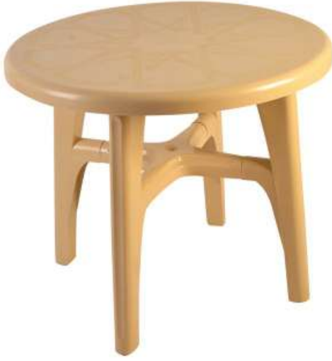
طاولة دائرية (أرجل قابلة للإزالة) Round Table (Removable Legs)