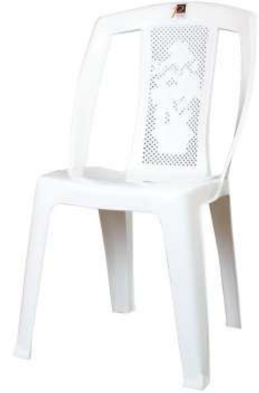
كرسي ملكي بدون يد Royal Armless Chair

Length : 580 mm : الطول Width : 575 mm : العرض Height : 915 mm : الارتفاع