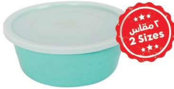
زبدية مع غطاء (٤ لتر) Basin with Cover (4 Ltr)

Diameter : 220 mm : قطر الدائرة Height : 120 mm : الارتفاع