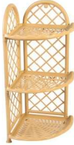
أرفف حمام ركن ٣ دور Corner Shelves (3 Rack)

Length : 295 mm : الطول Width : 295 mm : العرض Height : 383 mm : الارتفاع