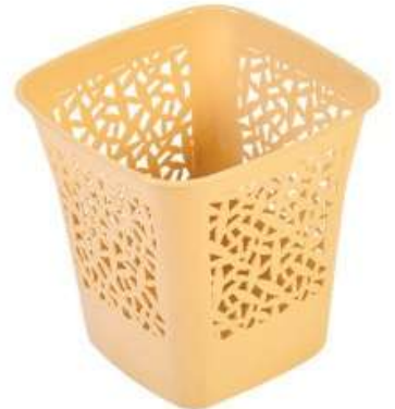
سلة مهملات شكل ورد (٨ لتر) Flower Trash Bin (8 Ltr)

Length : 245 mm : الطول Width : 195 mm : العرض Height : 290 mm : الارتفاع