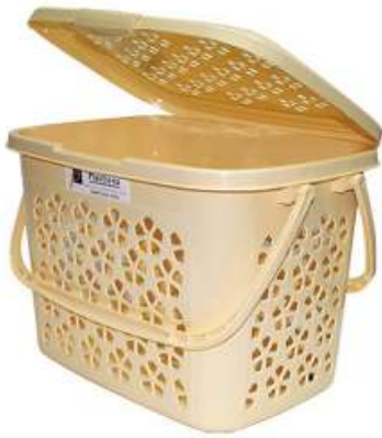
سلة رحلات كبيرة Picnic Basket (Large)