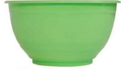
زبدية رسمة ورد (٣ لتر) Flower Bowl (3 Ltr)

Diameter : 305 mm : قطر الدائرة Height : 138 mm : الارتفاع