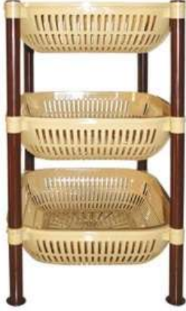
أرفف تخزين مستطيل (٣ دور) Rectangle Shelves (3 Rack)