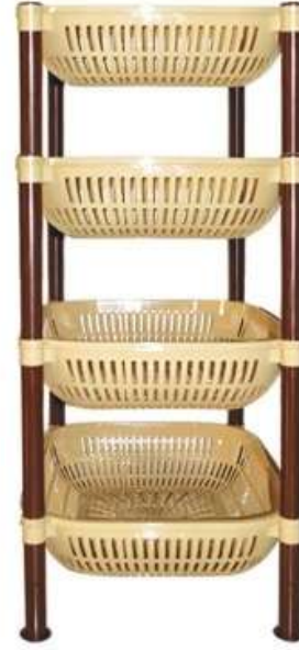
أرفف تخزين مستطيل (٤ دور) Rectangle Shelves (4 Rack)

Length : 470 mm : الطول Width : 370 mm : العرض Height : 600 mm : الارتفاع