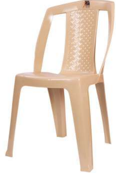
كرسي المدينة بدون يد City Armless Chair

Length : 580 mm : الطول Width : 575 mm : العرض Height : 915 mm : الارتفاع