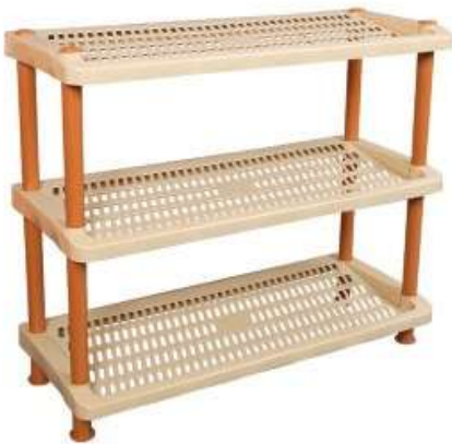
أرفف جزم ٣ دور Shoe Rack (3 Rack)

Length : 295 mm : الطول Width : 295 mm : العرض Height : 865 mm : الارتفاع