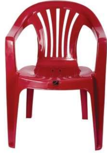
كرسي مرجان Morgan Chair

Length : 600 mm : الطول Width : 555 mm : العرض Height : 760 mm : الارتفاع