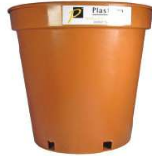
مركز زرع بدون صحن مقاس 10 Planter without Tray Size 10 (500ml)

Diameter : 165 mm : قطر الدائرة Height : 175 mm : الارتفاع