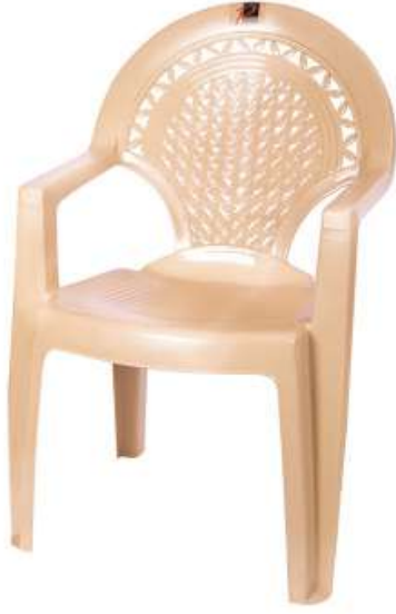
كرسي المدينة City Chair