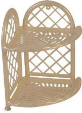
أرفف حمام ركن ٢ دور Corner Shelves (2 Rack)