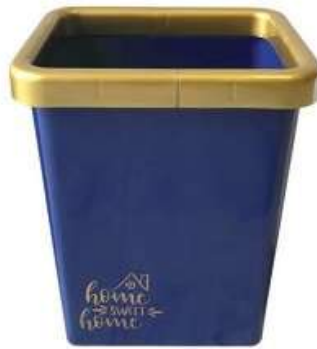
سلة مهملات مع برواز (٨ لتر) Trash Bin with Frame (8 Ltr)

Diameter : 258 mm : قطر الدائرة Height : 405 mm : الارتفاع