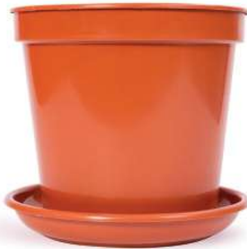
مركز زرع مع صحن مقاس 30 Planter with Tray Size 30 (15Ltr)

Diameter : 103 mm : قطر الدائرة Height : 100 mm : الارتفاع