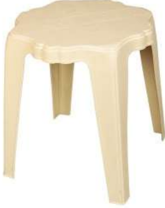
طاولة شاهی (أرجل ثابتة) Tea Table