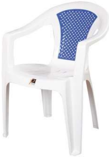
كرسي كلاسيك (٢ لون) Classic Chair (2 Color)

Length : 600 mm : الطول Width : 555 mm : العرض Height : 760 mm : الارتفاع