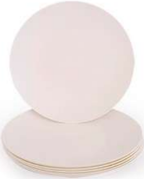
صحن طعام Food Plate

Length : 340 mm : الطول Width : 174 mm : العرض Height : 18 mm : الارتفاع