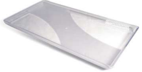
صحن كريستال مستطيل Tray Crystal Tray

Diameter : 300 mm : قطر الدائرة Height : 30 mm : الارتفاع