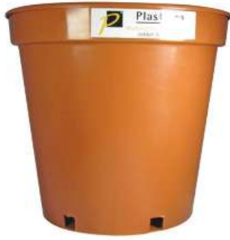
مركز زرع بدون صحن مقاس 16 Planter without Tray Size 16