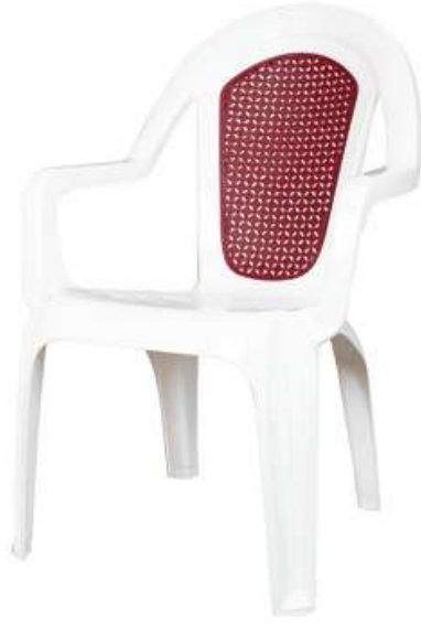
كرسي لؤلؤي (٢ لون) Pearl Chair (2 Color)