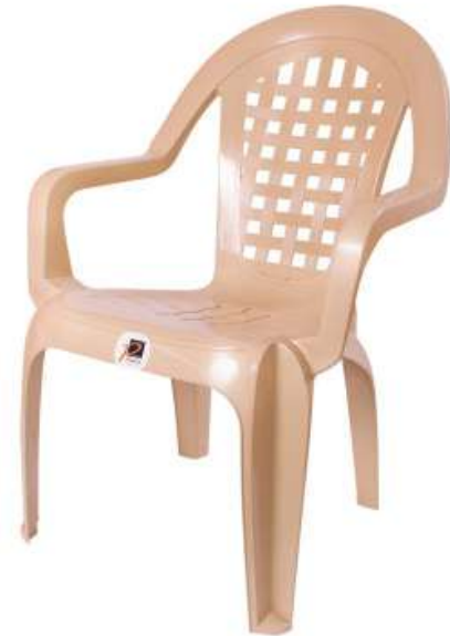
كرسي ماجستيك Majestic Chair

Length : 488 mm : الطول Width : 405 mm : العرض Height : 863 mm : الارتفاع