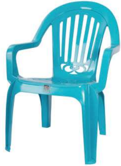
كرسي زمردى Emerald Chair

Length : 635 mm : الطول Width : 575 mm : العرض Height : 890 mm : الارتفاع