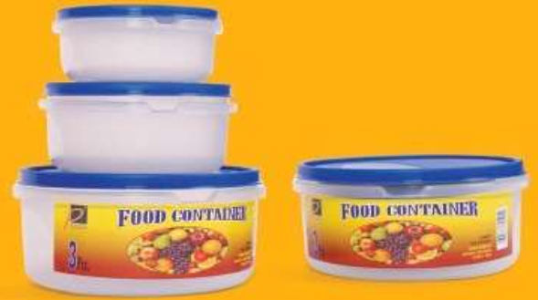
كاسة ديلوكس (طقم ٣ قطع) Food Container (3Pcs)