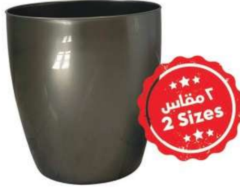
سلة مهملات أوربت بدون غطاء (١٠ لتر) Orbit Trash Bin without Cover (10 Ltr)