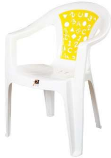
كرسي حروف (٢ لون) Alphabetic Chair (2 Color)

Length : 600 mm : الطول Width : 555 mm : العرض Height : 760 mm : الارتفاع