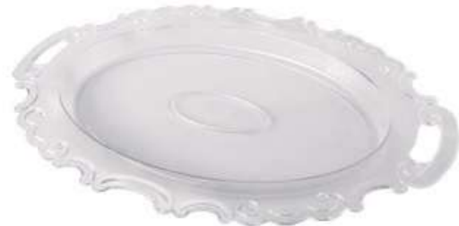
صحن تقديم كريستال مع غطاء Crystal Tray with Cover

Diameter : 350 mm : قطر الدائرة Height : 45 mm : الارتفاع