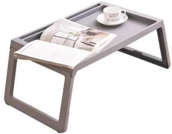
طاولة بلاستيك عصرية (قابلة للطي) كمبيوتر Modern Desk (Foldable)

Length : 795 mm : الطول Width : 795 mm : العرض Height : 700 mm : الارتفاع