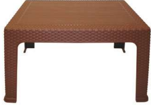
طاولة بلاستيك تصميم راتان مستطيلة Plastic Rattan Table (Coffee Table)

Length : 420 mm : الطول Width : 420 mm : العرض Height : 445 mm : الارتفاع