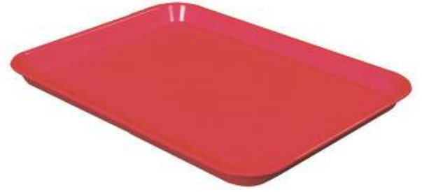
تبيسي تقديم متعدد الإستخدام (للمطاعم) Multi Use Tray

Length : 545 mm : الطول Width : 370 mm : العرض Height : 65 mm : الارتفاع