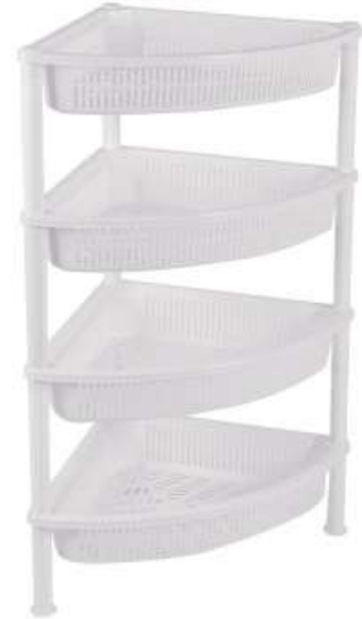
أرفف تخزين زاوية (خضار) ٤ دور Vegetable Shelves (Corner 4 Rack)

Length : 560 mm : الطول Width : 385 mm : العرض Height : 595 mm : الارتفاع