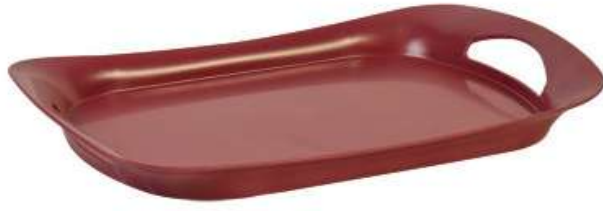
تبيسي تقديم مع يد Food Tray with Handle