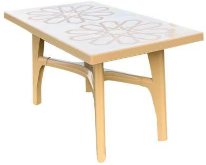
طاولة مستطيلة كبيرة (أرجل قابلة للإزالة) Rectangle Table (Removable Legs)

Diameter : 900 mm : قطر الدائرة Height : 750 mm : الارتفاع