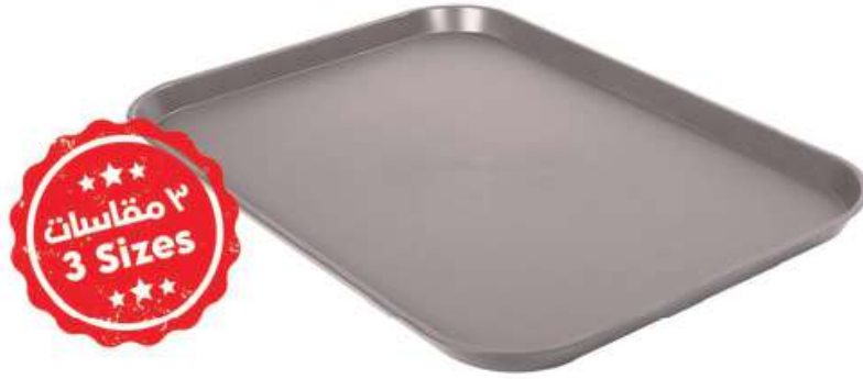
تبيسي كبير Food Tray (Large)

Length : 410 mm : الطول Width : 300 mm : العرض Height : 20 mm : الارتفاع