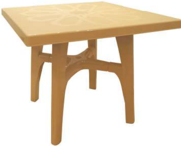
طاولة مربعة كبيرة (أرجل قابلة للإزالة) Square Table (Removable Legs)

Length : 1410 mm : الطول Width : 800 mm : العرض Height : 760 mm : الارتفاع