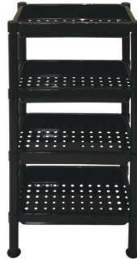
أرفف تخزين مستطيل (٤ دور) Rectangle Shelves (4 Rack)

Length : 375 mm : الطول Width : 245 mm : العرض Height : 600 mm : الارتفاع