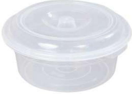
زبدية مع غطاء (٥ لتر) Basin with Cover (5 Ltr)